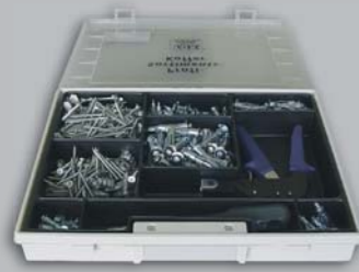
PROFISORTIMENT MHD & GD