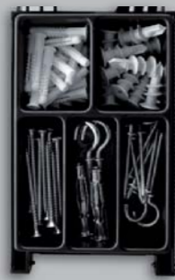
MONTEUR GIPS PLASTERBOARD KIT COFFRET PLÂCO