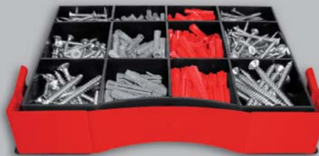
MONTEUR MULTI BUILDERS FIXING KIT COFFRET MULTIFONCTION

+ Gängige Größen sofort zur Hand + Stabiler Transportbehälter + Passt in alle gängigen Lager- und Regalsysteme