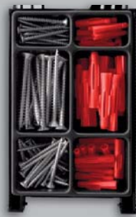
MONTEUR ALLROUND ALLROUND KIT COFFRET POLYVALENT