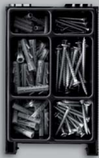
MONTEUR BETON CONCRETE KIT COFFRET BÉTON